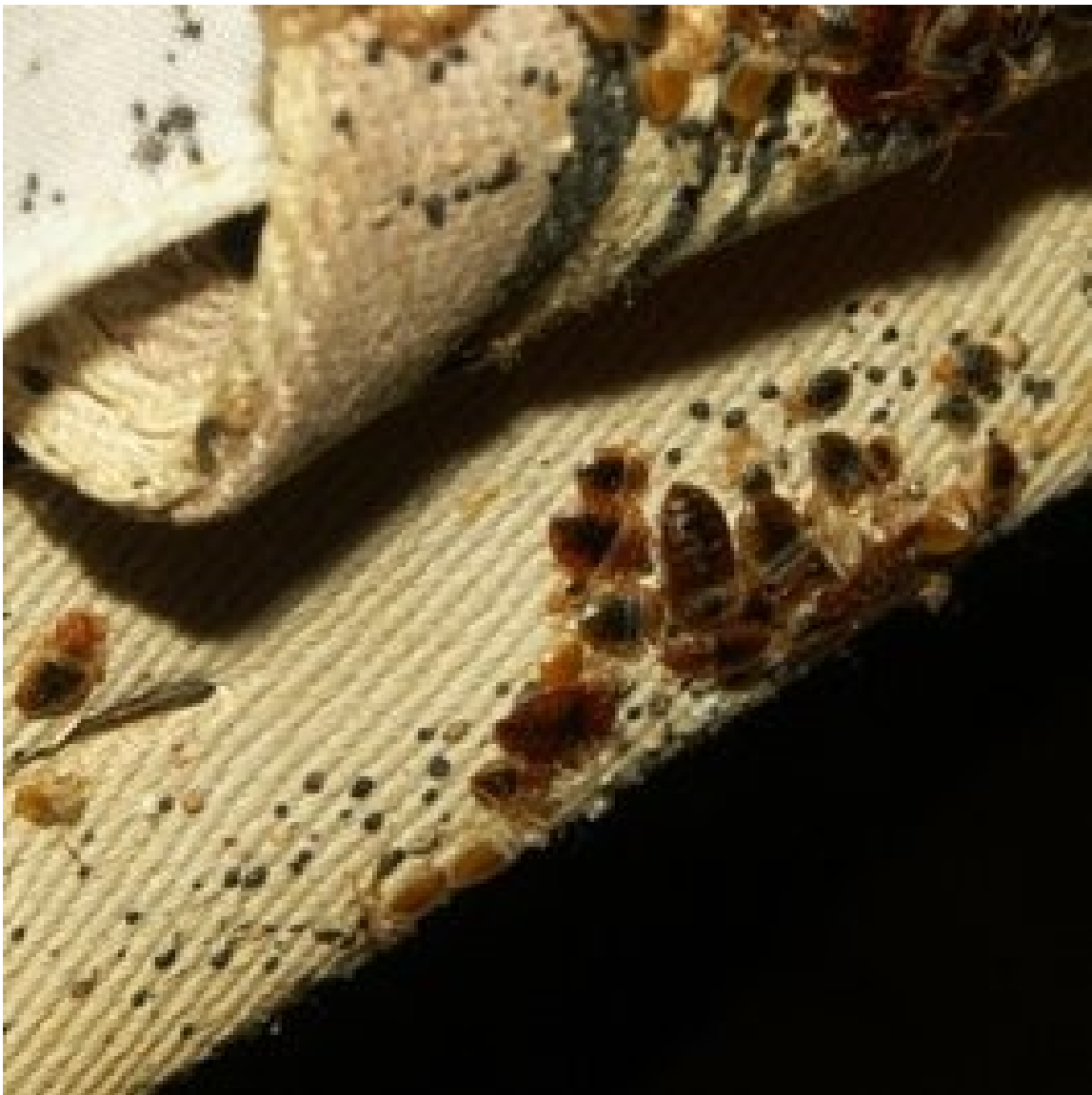
Correa de lona de un somier viejo que alberga chinches de cama adultas, pieles mudadas, excrementos y huevos.