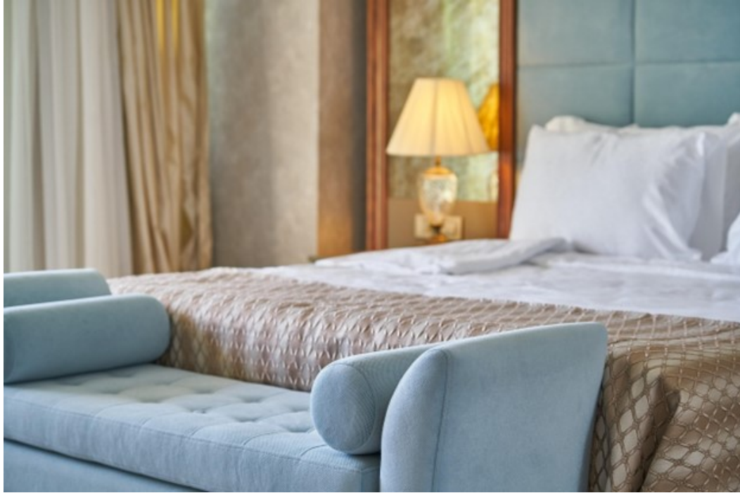
Habitación de hotel

Las chinches de cama son la pesadilla de todo viajero: pequeñas, sigilosas y capaces de convertir unas vacaciones de verano idílicas en un desastre lleno de picazón. Ya sea en una cabaña rústica junto al lago o en un resort de cinco estrellas, las chinches de cama pueden esconderse en cualquier alojamiento, por lo que la vigilancia es clave para evitar una infestación inesperada.