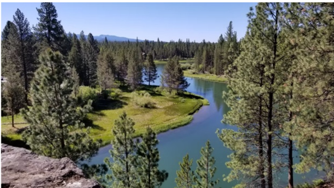
Las zonas húmedas cerca del río Deschutes, en el sur del condado de Deschutes, ofrecen condiciones ideales para ciertas especies de mosquitos.

Además, el condado de Jackson detectó recientemente la presencia del mosquito Aedes aegypti , una especie tropical invasora conocida por su comportamiento agresivo al picar y su capacidad para transmitir enfermedades como el dengue, la fiebre amarilla, el chikunguña y el virus del Zika. El riesgo de transmisión de enfermedades sigue siendo bajo.