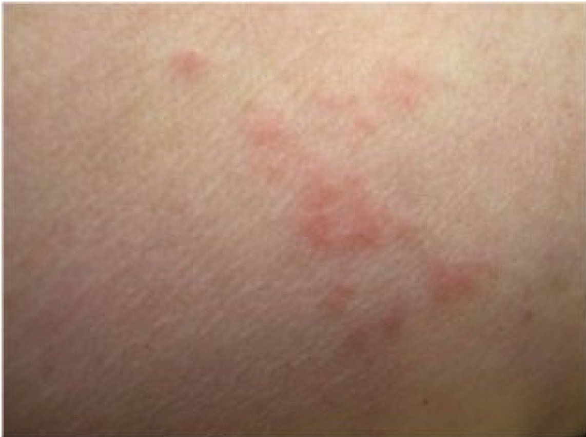
Foto del brazo de una persona con picaduras de chinches de cama.