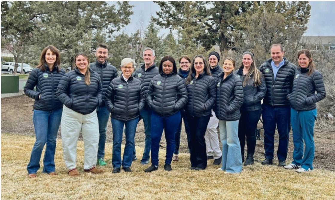
Foto del equipo de Prevención y Manejo de Enfermedades Transmisibles del Condado de Deschutes.